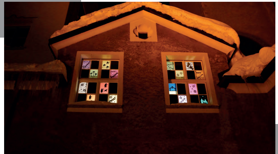
Bild: Adventsfenster in der Kirche St. Johann

Im Berichtsjahr resultierte ein Gewinn von CHF 1'040.84. Per 31.12.2023 weist die Hilfskasse ein Vermögen von CHF 44'611.02 aus.