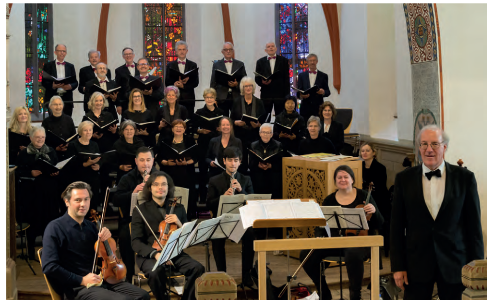
Bild: Passionskonzert 2023

Das offene Meditationsangebot im Turmzimmer der Kirche St. Johann konnte in loser Folge, abwechselnd am Mittwochvormittag oder -abend weitergeführt werden. Dagegen musste die Durchführung des Kurses «Exerzitien im Alltag» verschoben werden.