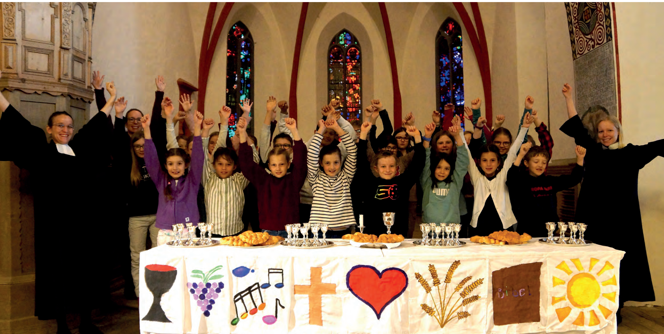
Bild: Abendmahl Einführung

Mein Dank gilt den Vorstandskollegen und -kollegin, den Mitarbeitenden und den Freiwilligen, die sich für das kirchliche Leben und ein gutes Miteinander in unserer Gemeinde und in ganz Davos reformiert einsetzen.